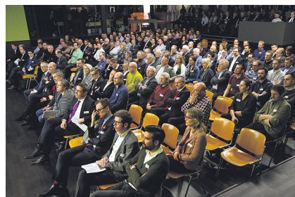
Die Referenten diskutierten in einer gefüllten Aula über die Wirtschaftsdaten, die Arealentwicklungen und kantonale Unterstützungen.