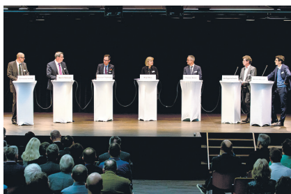
Wie wird die regionale Wirtschaft in Arealentwicklungen einbezogen, welches sind Unterschiede zu stadtnahen Arealen? Das Podium gab Antworten.