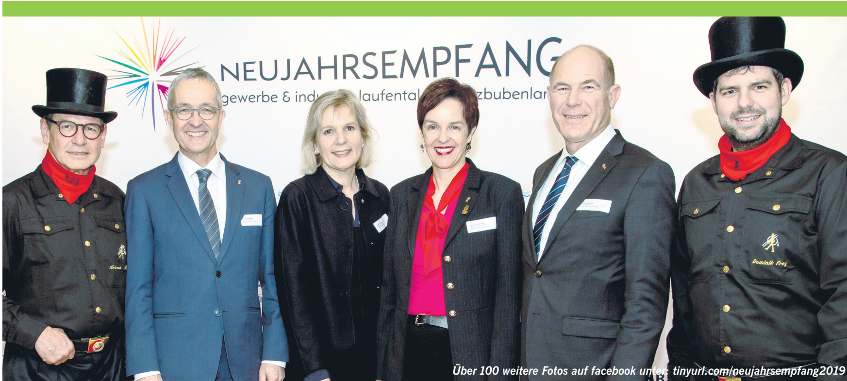
Über 100 weitere Fotos auf facebook unter: tinyurl.com/nejahrsempfang2019